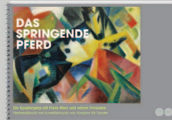
Das springende Pferd Ein Spaziergang mit Franz Marc und seinen Freunden