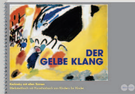
Der gelbe Klang Kandinsky mit allen Sinnen