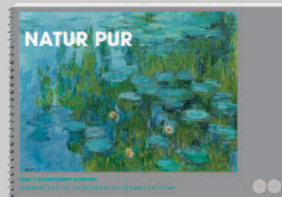
Natur pur Was Landschaften erzählen